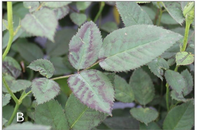
Foto 2: Effect van Elasto G5 op uitvloeiing van de spuitvloeistof na toevoeging van de kleurstof 'brilliant black'. A: Behandeling met Frupica, B: Behandeling met Frupica + Elasto G5 (zie 'doseringen')